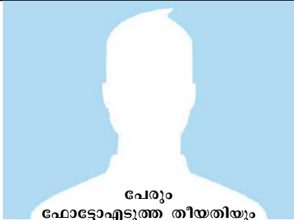
പേരും ഫോട്ടോ എടുത്ത തീയതിയും